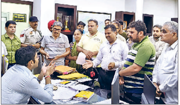
रोहतक। आयुक्त से मिलते सेक्टर दो तीन मार्केट के दुकानदार।