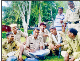
रोहतक। मानसरोवर पार्क में मीटिंग करते ग्रामीण चौकीदार सभा के सदस्य।