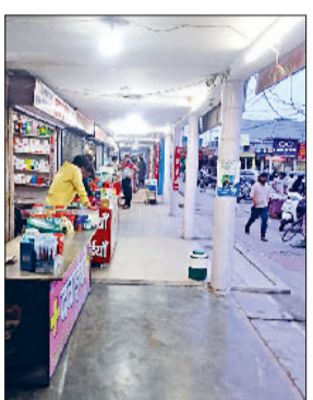
रोहतक। दुकानों के बाहर बनाया गया नौ फुट का कोरिडोर।

सेक्टर दो तीन मार्केट के दुकानदारों ने दुकान के बाहर कोरिडोर में चार फुट जगह की मांग की है ताकि वह अपना कारोबार आराम से कर सकें। इस मांग को लेकर सोमवार को दुकानदार नगर निगम आयुक्त डॉ. आनंद कुमार शर्मा से मिले। आयुक्त ने उनकी मांग सुनने के बाद स्पष्ट कहा कि अतिक्रमण तो हटाना पड़ेगा। इसके लिए देर शाम एलओ, एसडीओ सहित अन्य अधिकारियों को मौका निरीक्षण के लिए भेजा गया। निगम की तरफ से मौके का निरीक्षण कर तीन शोड हटाने के आदेश दिए गए, साथ ही कहा कि दुकानदार केवल फोल्ड करने वाला टीन शोड ही लगावा सकते हैं, वह भी केवल धूप के समय खोला जा सकता है। अब बुधवार को अधिकारी कोरिडोर की जगह दुकानदारों के लिए छोड़ने पर निर्णय लेंगे। दुकानदारों ने बताया कि कई